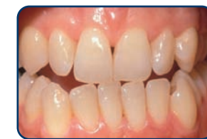
Voor het bleken

De lengte van een bleekbehandeling hangt af van de bleekmethode. Bij de thuisbleekmethode duurt het meestal twee weken voordat u een gewenst resultaat bereikt.