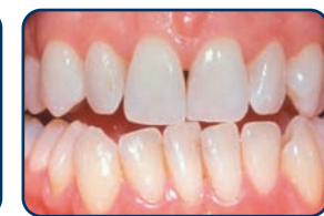
Resultaat na tien dagen bleken met de thuisbleekmethode onder begeleiding van de tandarts